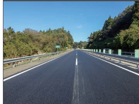
仙台松島道路 舗装修繕工事

〒980-0811 仙台市青葉区一番町二丁目2番13号 TEL022-225-4421 FAX022-221-3072 http://www.h-con.co.jp