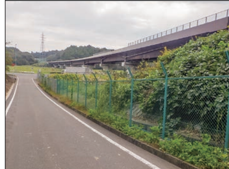
仙台松島道路 橋梁修繕(桜戸大橋外)工事

受賞者 (工事名=受賞者の順) ▽仙台松島道路 橋梁修繕(桜戸大橋外)工事=東日本コンクリート ▽仙台松島道路 舗装修繕工事=宮城建設工業