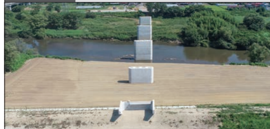
土木一式工事 (仮称)栗原東大橋P1・P2橋脚工事

宮城県栗原市築館源光12-24 TEL.0228(22)2102 FAX.0228(22)1091 URL http://www.noguchikensetsu.co.jp/