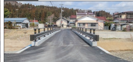
土木一式工事 市道高橋芳沢線橋梁災害復旧工事

本社 宮城県栗原市若柳字川北原畑21-1 TEL.0228(32)3211(代) FAX.0228(32)6595