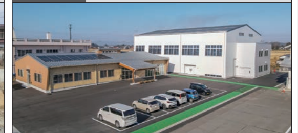
設備工事 志波姫公民館建設電気設備工事

本社 〒987-2308 宮城県栗原市一迫真坂字畑中7-1 TEL.0228(52)2171~3 FAX.0228(52)2170 E-mail:k_sako_71@live.jp