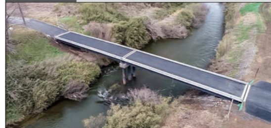
土木一式工事 阿久戸補修工事

〒987-2304 宮城県栗原市一迫北沢十文字1-2 TEL.0228(52)2517 FAX.0228(52)4517