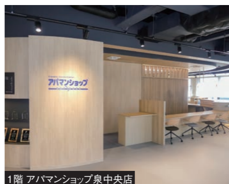
1階 アバマンショップ泉中央店