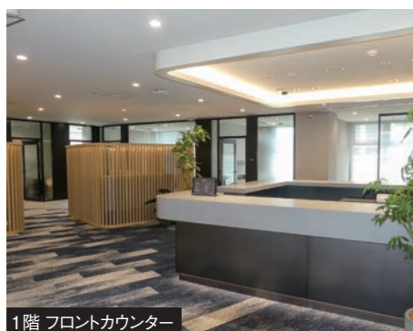
1階 フロントカウンター