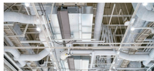
空調衛生設備工事