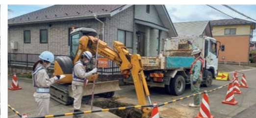
水道施設土木工事